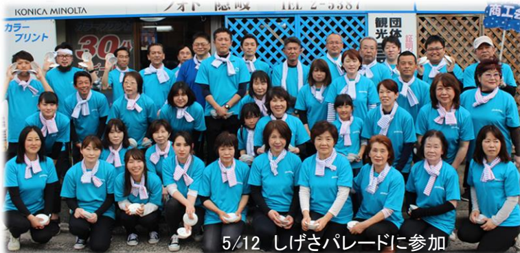
5/12 しげさパレードに参加

商工会のホームページ http://oki.shoko-shimane.or.jp/