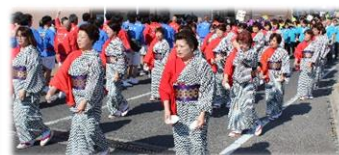
5月11日しげさパレード

商工会のホームページ http://oki.shoko-shimane.or.jp/