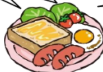
隠岐の島町役場 保健課