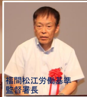
福間松江労働基準監督署長