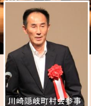
川崎隠岐町村会参事