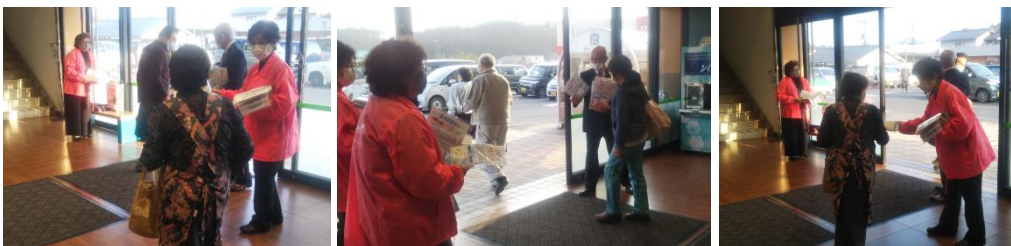
2月22日 サンテラス店頭でのチラシ配布の風景

2月22日、隠岐の島町経済六団体協議会(建設業協会・JA・森林組合・JF・町観光協会・商工会)、隠岐の島町防衛協会、隠岐の島町における「竹島の日」の取組みとして、竹島に関するチラシと除菌ウェットティッシュの配布を、人が多く集まる場所「サンテラス・ひまり・ジュンテンドー・隠岐汽船上屋・隠岐空港」で行いました。